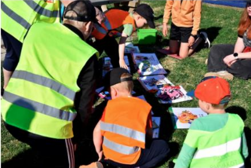
Paijulan päiväkodin lapset harjoittelivat oikeanlaista kierrätystä. JESSE RANTA