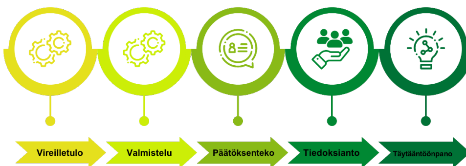
Kuva. Kunnallisen päätöksenteon prosessi vireilletulosta täytäntöönpanoon.

Vireilletulo: Vammaisneuvosto voi tehdä aloitteita ja esityksiä asioista, jotka koskevat vammaisia henkilöitä.