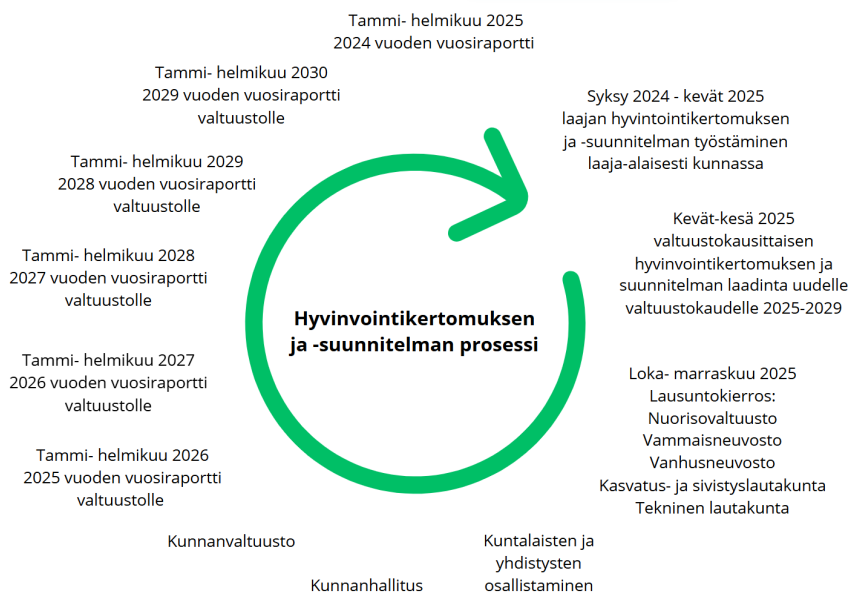
Kuva 2. Hyvinvointikertomuksen ja -suunnitelman prosessi.

Henkilöstön kanssa suunnitelmaa on käsitelty ennalta laaditun pohja-aineiston avulla, jossa on kuvattu kuntalaisten nykyistä hyvinvoinnin tilaa. Aineiston ja muiden tunnistettujen ilmiöiden pohjalta tehdyt huomiot on kirjattu ylös ja niitä on hyödynnetty suunnitelman laadinnassa. Nuorisovaltuuston ja vanhusneuvoston kokouksissa käsitellyt asiat on myös kirjattu ylös ja huomioitu suunnitelman laadinnassa. Hyvinvointitoimikunta laati suunnitelman luonnoksen, joka lähetettiin lausuntokierrokselle nuorisovaltuustoon, vanhus- ja vammaisneuvostoon, kasvatus- ja sivistyslautakuntaan sekä tekniseen lautakuntaan. Hyvinvointisuunnitelman luonnos on ollut kommentoitavana kunnan verkkosivuilla. Hyvinvointitoimikunta käsitteli saapuneet kommentit ja lausunnot ja teki tarvittavat muutokset hyvinvointisuunnitelmaan. Hyvinvointisuunnitelman toteutumista tullaan raportoimaan valtuustolle osana vuosiraporttia.